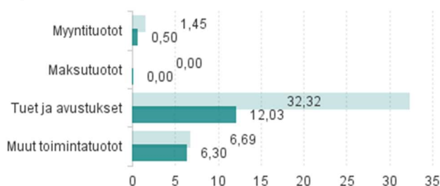
Ulkoisten toimintatuottojen toteuma vs. talousarvio 2024, M€